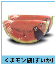
くまモン袋(すいか)