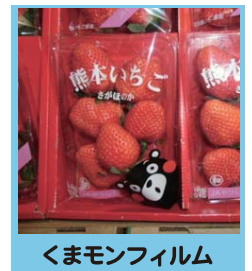
くまモンフィルム