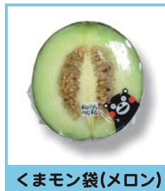
くまモン袋(メロン)