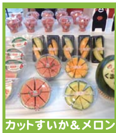
カットすいか&メロン