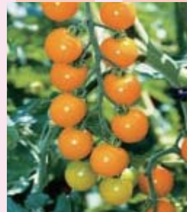
豊富な色のミニトマト