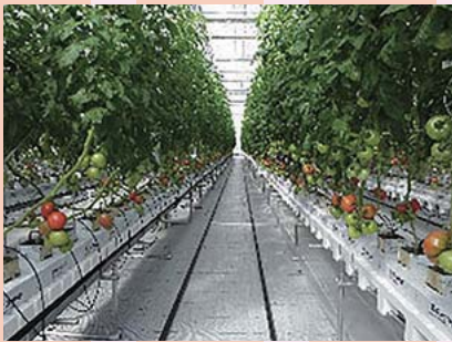
最新鋭のトマト園場

トマトの赤い色素成分リコピンは、高い抗酸化作用があり、老化予防や発がんを抑える効果があるといわれています。