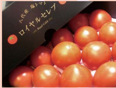
八代産の塩トマト